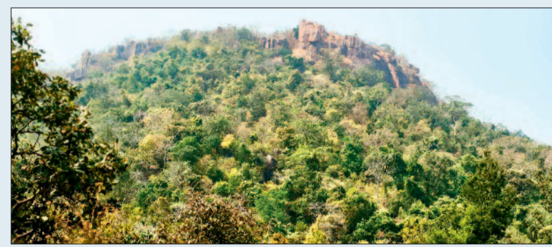
महाशिवरात्रि को लेकर व्यापक तैयारी